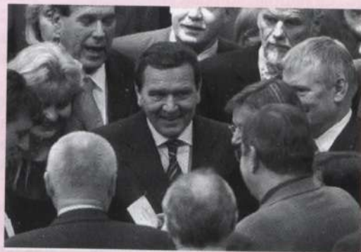
Герхард Шредер (в центре)

Аналогичная ситуация сложилась и в ходе нынешних выборов. В частности, «зеленые», с самого начала кампании четко обозначившие курс на сохранение коалиции с СДПГ, в