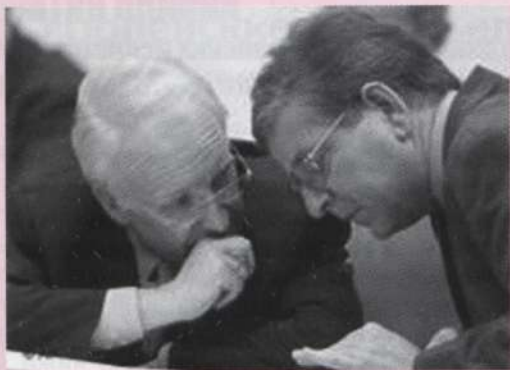
Эдмунд Штойбер (слева)

но, уменьшился и размер депутатского корпуса – с 656 до 598 парламентариев 1 . Каждый из новых округов насчитывает в среднем около 250 тыс. жителей. Согласно новому закону, численность жителей отдельного избирательного округа не может отличаться от среднего показателя более чем на 15% (ранее эта цифра составляла 25%).